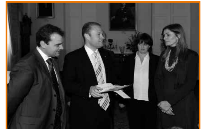
Xi whud mill-membri tal-Kumitat tal-Assoċjazzjoni Down Syndrome u l-familja tagħhom mal-Onorevoli Prim Ministru Dr J. Muscat u mal-Onor. Dr F. Mercieca