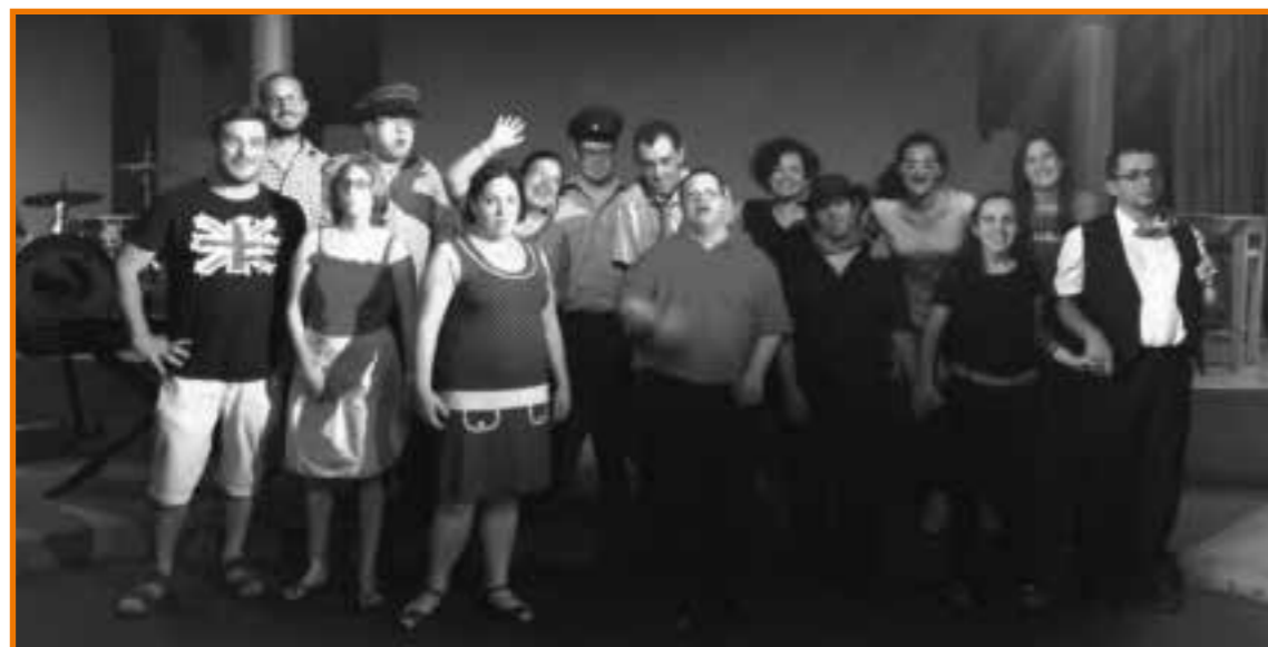
Drama group after their last performance

Lill-KMPG li ta' kull sena jivverifikaw il-kotba u l-kontijiet finanzjarji