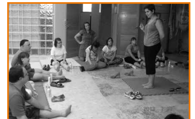
Žgħażaġh membri tal-Għaqda waqt il-laqgħat edukattivi